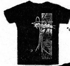
CRANIAL INCISORED "a mind-expanding headtrip"